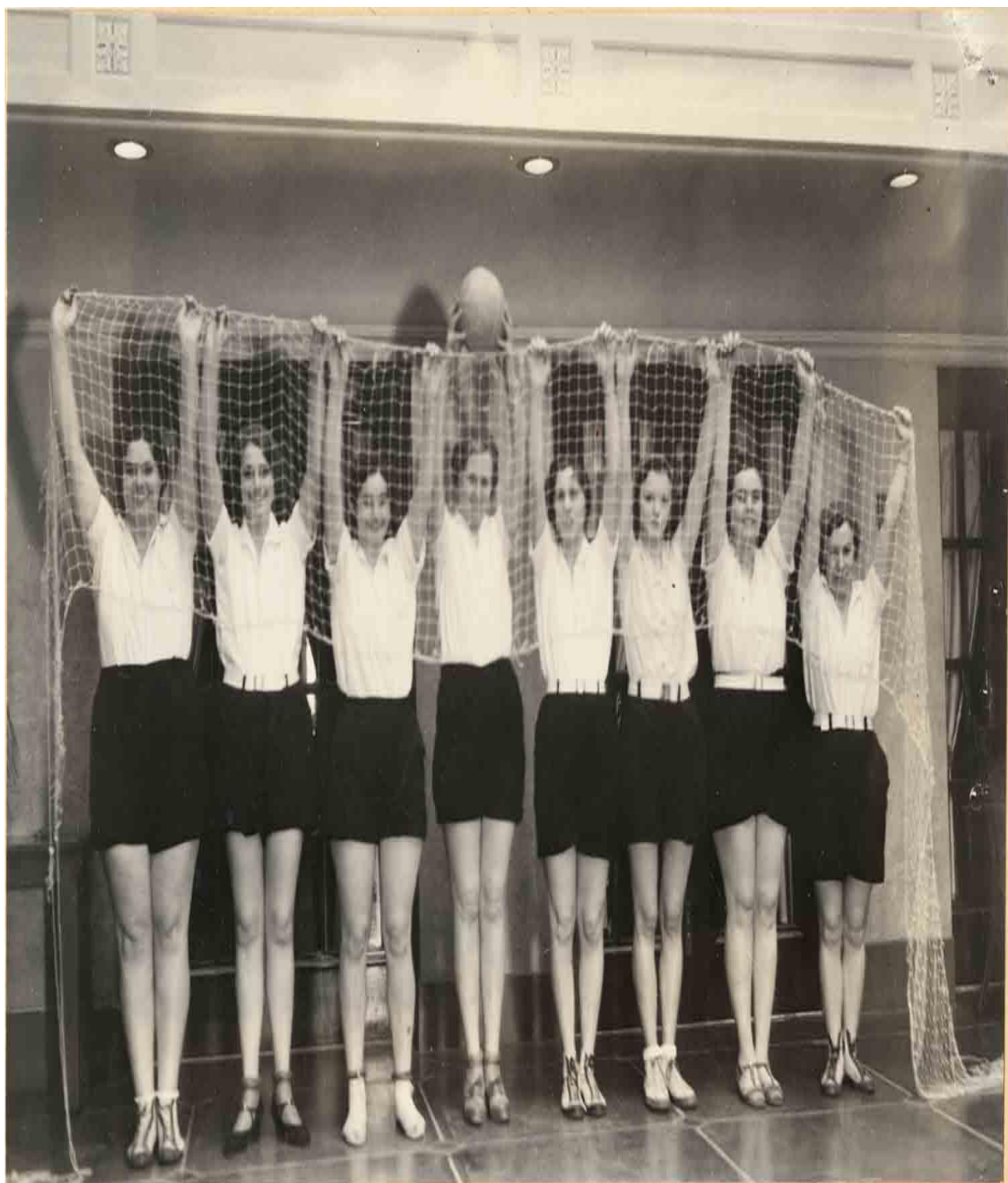
Prckové jsou na draka